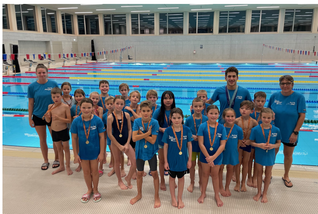
Kidsliga Team SCK