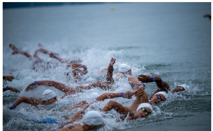
Open Water SM im Freibad Hörnli (S.36)

Redaktion und Gestaltung: Flurin Rickenbach und Marc Herzog Redaktion und Lektorat: Ruedi Herzog Druck: Schalk Druck GmbH