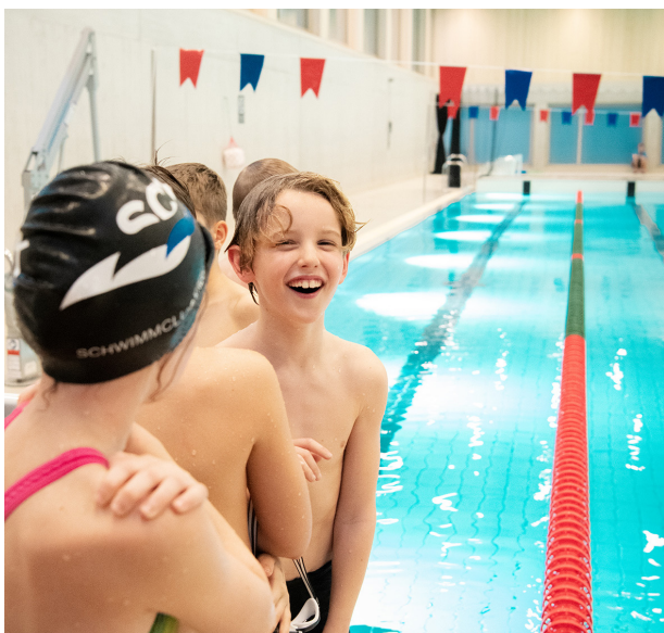
Gruppe Hai und Delfin