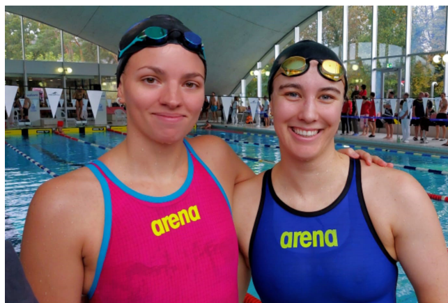
SCK Masters