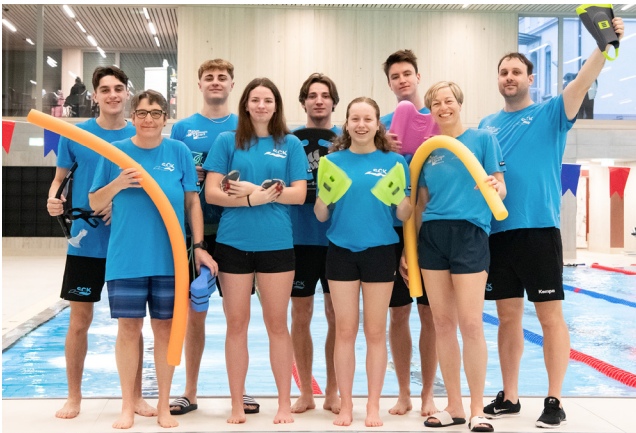
Trainerteam SCK