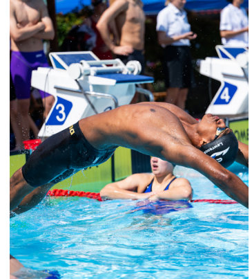
Ein SCKler an Olympia 2024 (S.25)