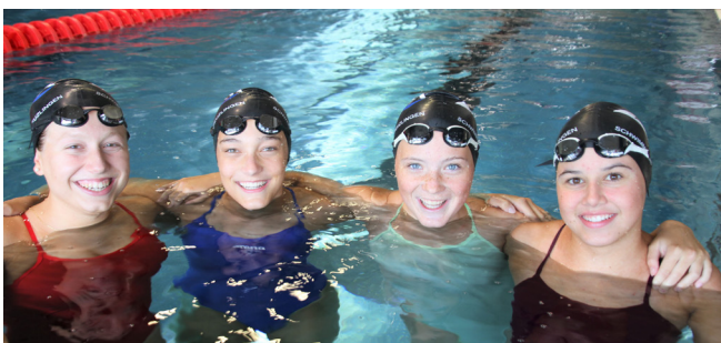
Damenstaffel an der Sommer SM