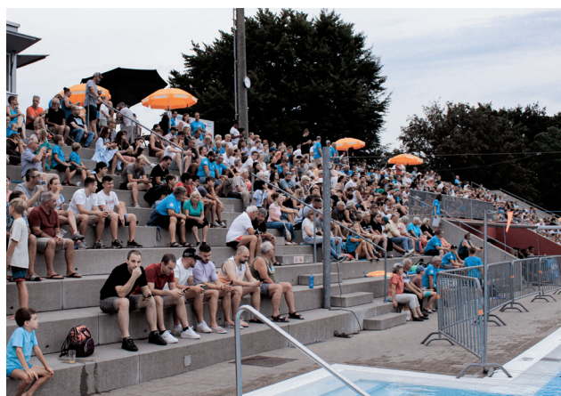
Heimspiel im Freibad Hörnli