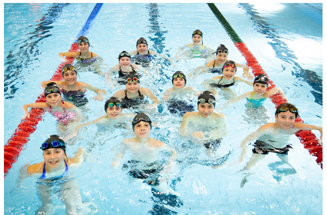
Teamfoto Nachwuchs A und B

Auch im Nachwuchsteam gab es Neuzugänge. Seit Saisonbeginn trainieren 17 SchwimmerInnen zwischen 9 und 14 Jahren bei Yvonne Schmalzer. Auch hier profitieren die Kinder von besseren Bedingungen als im alten Egelseebad und haben für ihre Trainingseinheiten etwas mehr Platz zur Verfügung. Das hilft vor allem beim genauen Ausführen von technischen Anforderungen wie Unterwasserphasen, Starts und Wenden. In ihren drei bis vier Wassertrainings pro Woche kommen die jungen AthletInnen auf jeweils 2 bis 2,5 Kilometer. Die meisten von ihnen sind in diesem Alter nun schneller als ihre Eltern im Wasser.