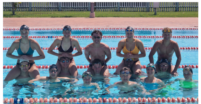
Trainingslager in Piombino

Ein grosser Pluspunkt der gemeinsamen Lager ist nicht zuletzt der soziale Aspekt, das Zusammensein mit den SchwimmfreundInnen und das Meistern von eventuellen Schwierigkeiten. Fragt man frühere LeistungsschwimmerInnen nach ihren Highlights im Sportlerleben, wird meistens von den coolen Trainingslagern geschwärmt.